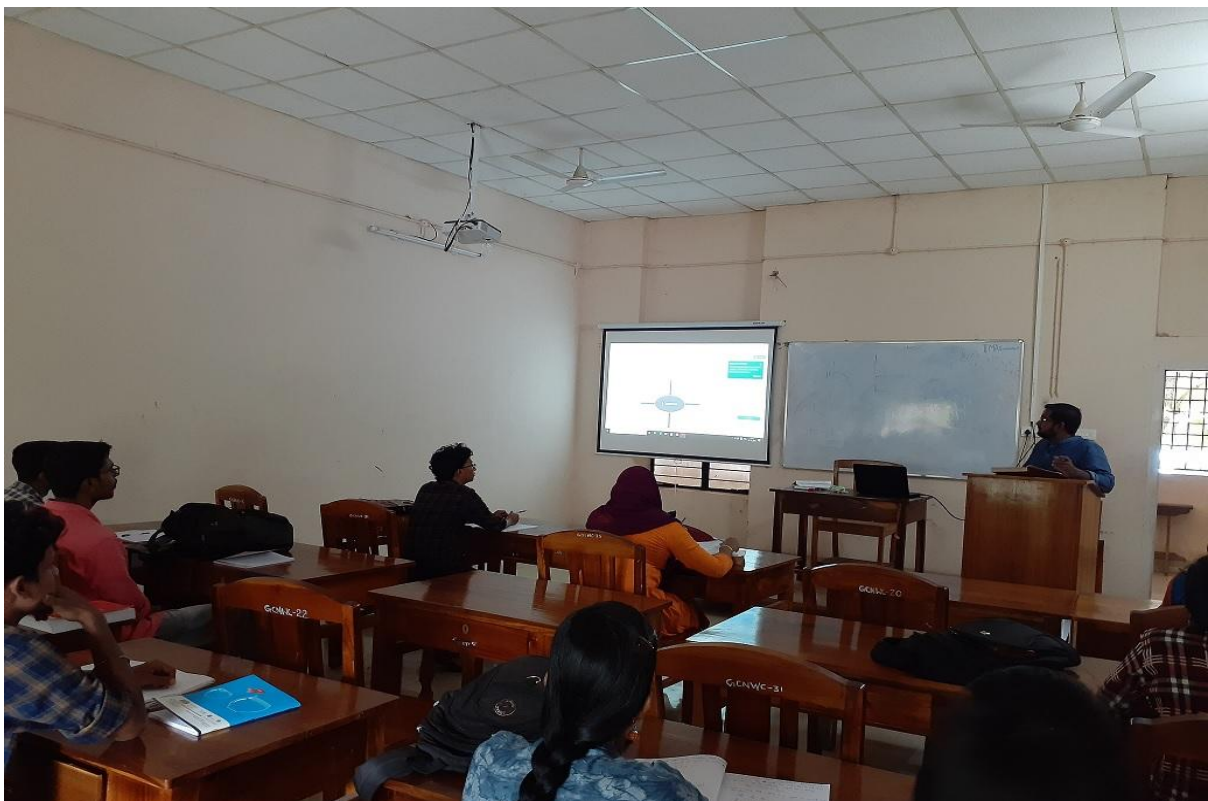
ICT Enabled Economics PG Class Room