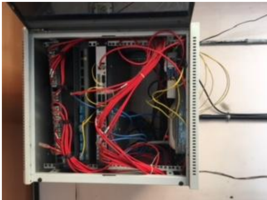
Main Internet Modem