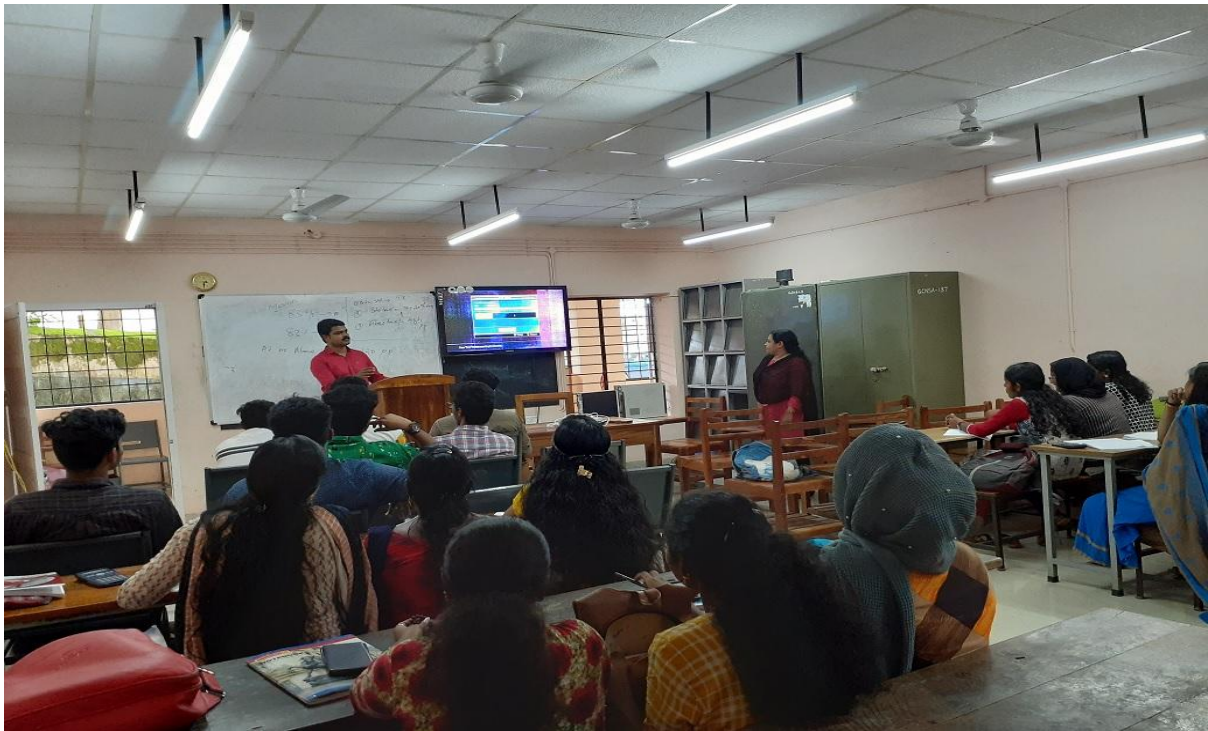
Commerce Smart Class Room