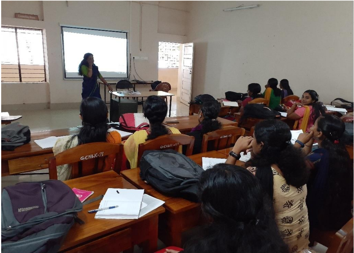
ICT Enabled Malayalam PG Class Room