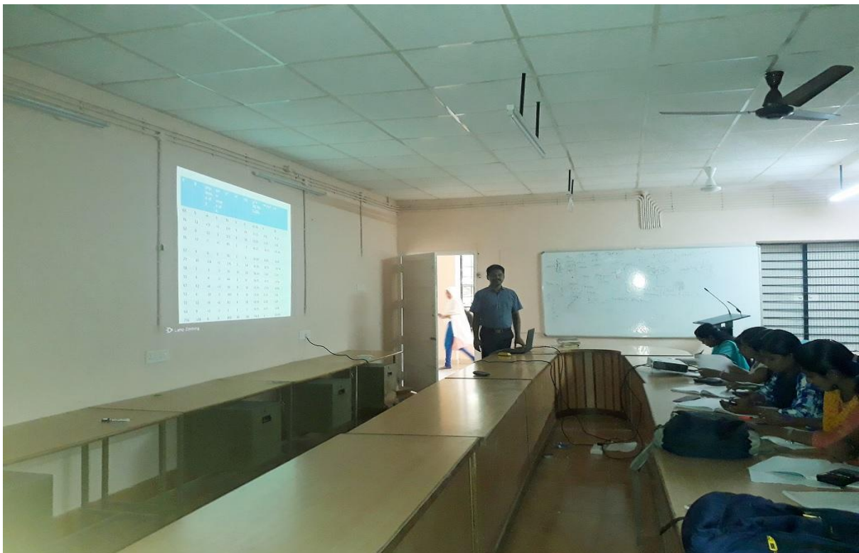
Commerce Research Centre