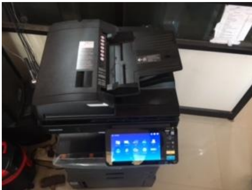
Photo Copier and Printer